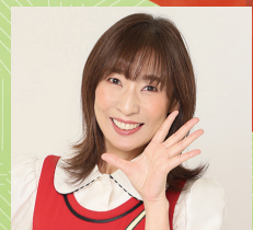
山本 かずみ (元NHK歌のお姉さん) ほか ※出演者はコンサートごとに変わります