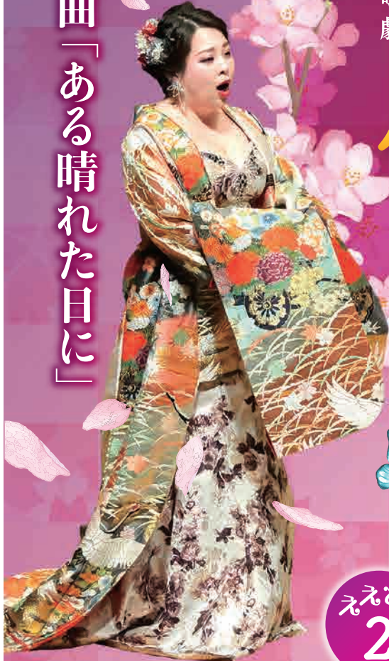
「ドリーム・コンチェルト2023」より