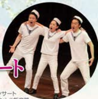
これまでの ハイライトコンサート 「オン・ザ・タウン」