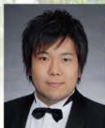
島影聖人 (ロドルフォ)