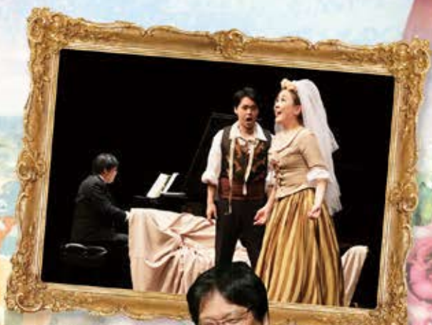
これまでの ハイライトコンサート 「フィガロの結婚」